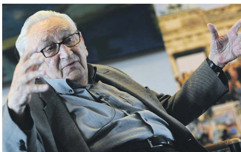
Egon Bahr (1922–2015)

Die IKG-Präsidentin lernte Bahr als »deutschen Patrioten mit Blick für die weltpolitischen Zusammenhänge« kennen, wobei sein Patriotismus nichts Enges oder Verstaubtes gewesen sei. »Ganz im Gegenteil«, schildert sie ihre persönlichen Erfahrungen, »Egon Bahr hatte den Mut und die