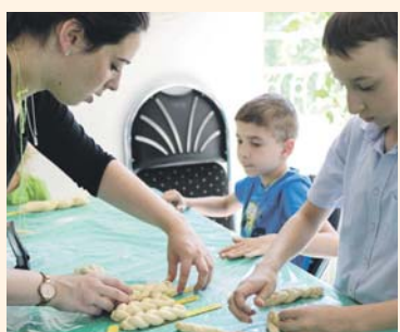
»Challah für alle« war immer freitags beim Day Camp das Motto.

CHABAD Spiel und Spaß waren angesagt, aber auch das Wissen kam beim diesjährigen Day Camp von Chabad Lubawitsch nicht zu kurz. Das Programm für Kinder zwischen drei und zwölf Jahren war gewohnt abwechslungsreich, reichte von Ausflügen in den Freizeit- und Tierpark bis hin zu Bastelstunden sowie einer Zaubershow. Wie immer war selbstverständlich auch für koschere Verpflegung gesorgt. Jeden Tag stand ein anderes Projekt auf dem Plan, nur an einem Tag, freitags, war das Programm immer gleich: Da backten die Kinder Challah für Schabbat. Auch hier waren die Teilnehmer des Day Camp mit Begeisterung dabei. ikg